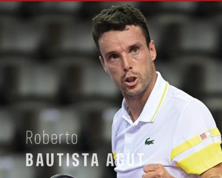
Roberto BAUTISTA AGUT