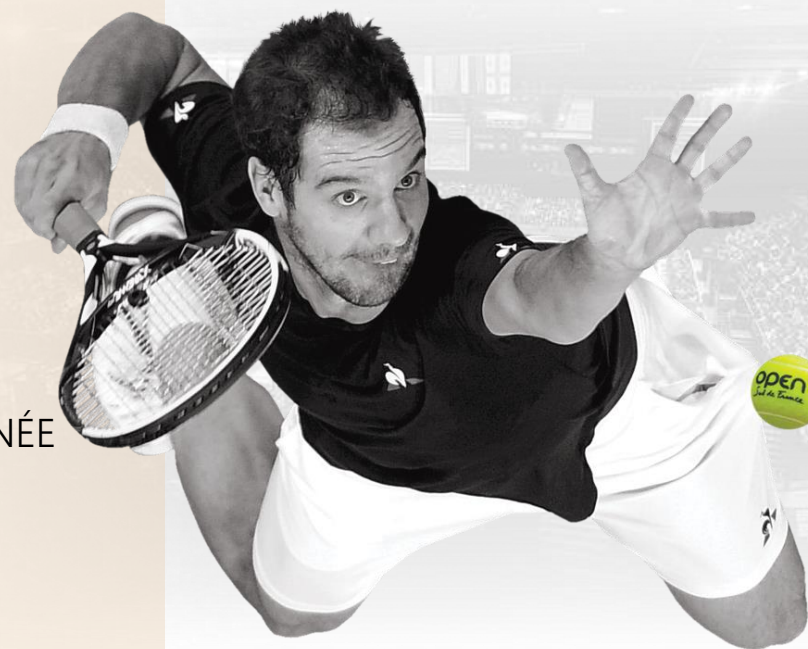
Richard GASQUET : vainqueur 2013 / 2015 / 2016