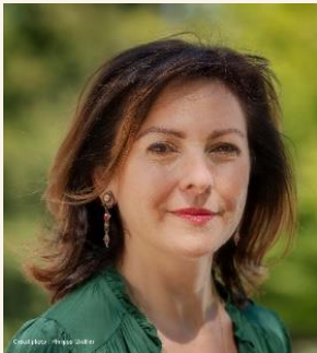
Carole Delga Présidente de la Région Occitanie / Pyrénées-Méditerranée

Partenaire de l'Open Sud de France – Montpellier 2022