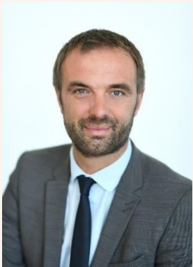
Michaël Delafosse, Maire de la Ville de Montpellier, Président de Montpellier Méditerranée Métropole

Le soutien des deux collectivités envers les compétiteurs et les médaillés olympiques demeure sans faille car ils ont valeur d'exemplarité pour inciter à l'activité physique et sportive, par et pour tous. Les intercommunalités de Montpellier, Sète et Millau portent et porteront une démarche collective, complémentaire et inédite en France afin de devenir Centre de préparation aux Jeux Olympiques et Paralympiques de 2024 (CPJ) après l'obtention du prestigieux label « Terres de Jeux ». Très bon Open Sud de France Montpellier à tous.