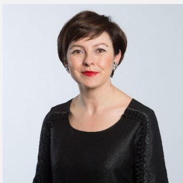
Carole DELGA Présidente de la Région Occitanie / Pyrénées - Méditerranée